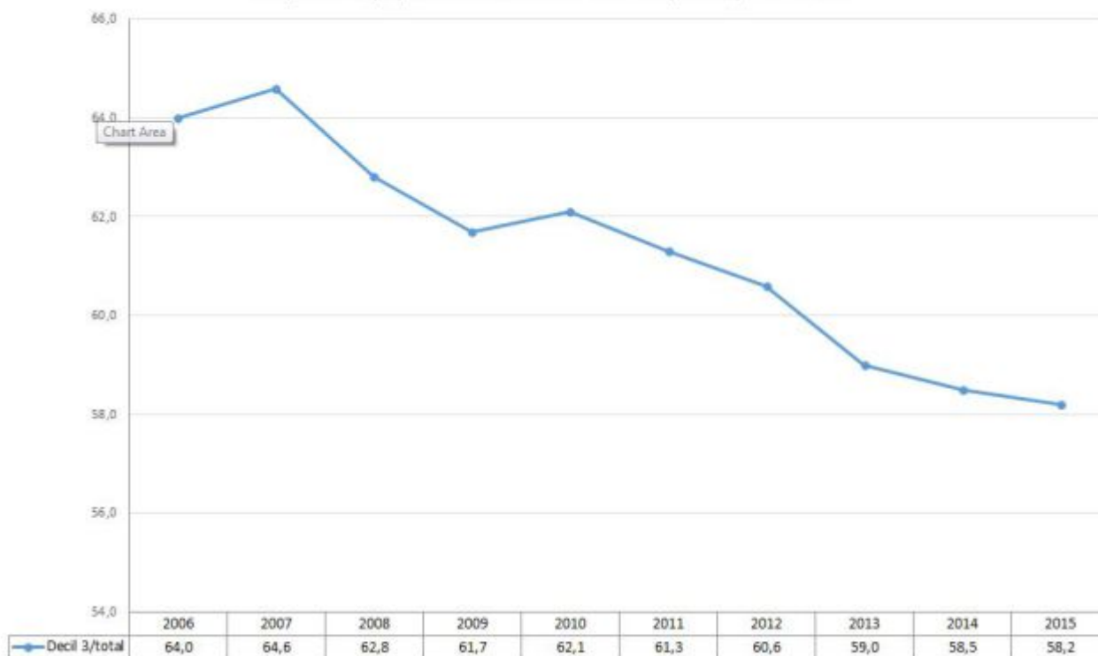
Deciles salariales. Proporción (%) del decil 3 sobre el total (media) de deciles